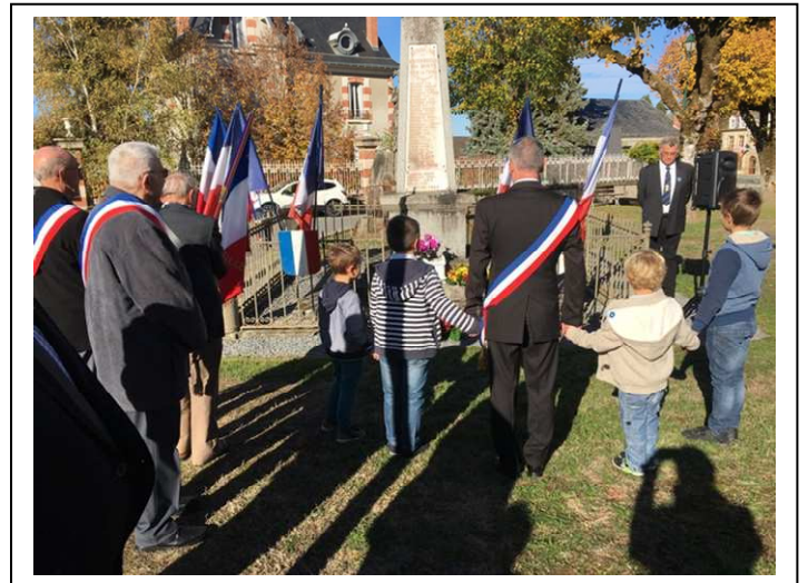
Dépôt de gerbe et minute de silence avec les enfants