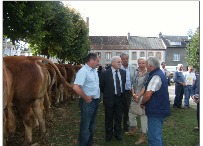
Rencontre avec les