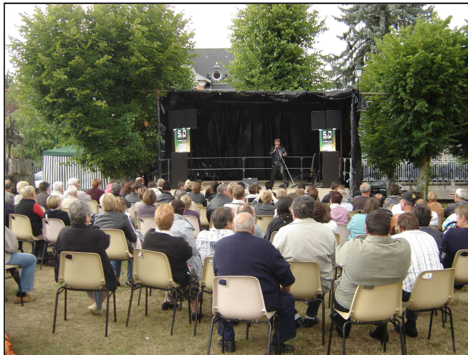
Fête communale 2011