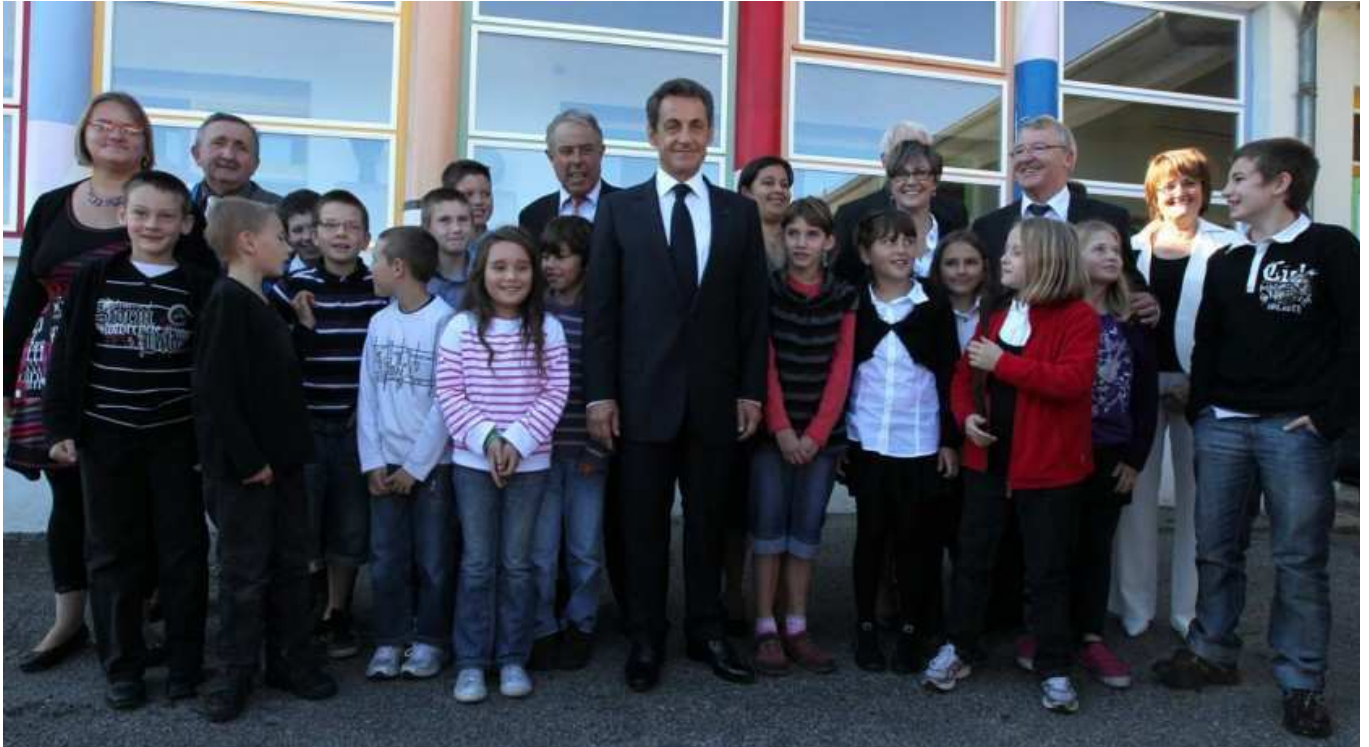
Classes de CM1 et de CM2 entourant le Président de la République