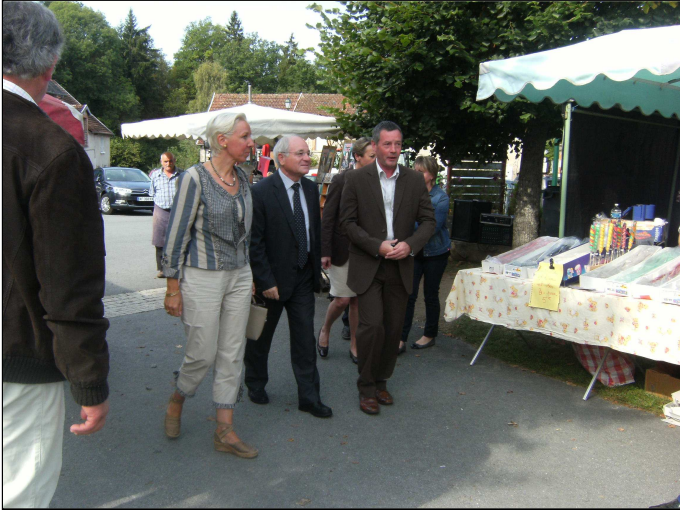
Accueil de Monsieur le Préfet exposants