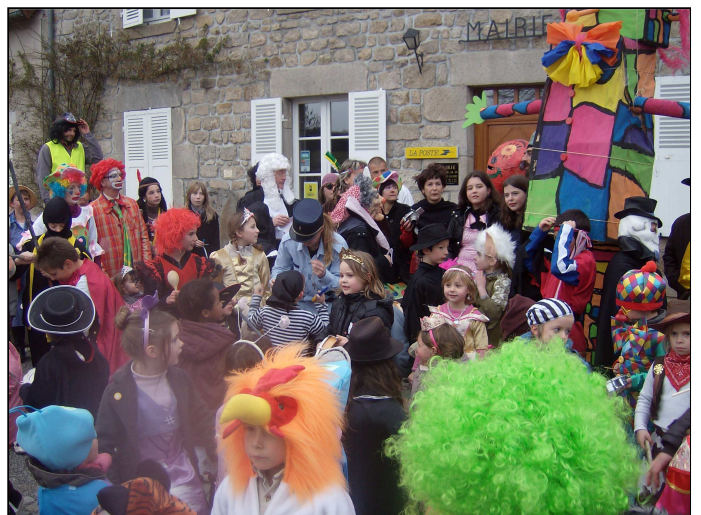
Parents d'élèves : Carnaval