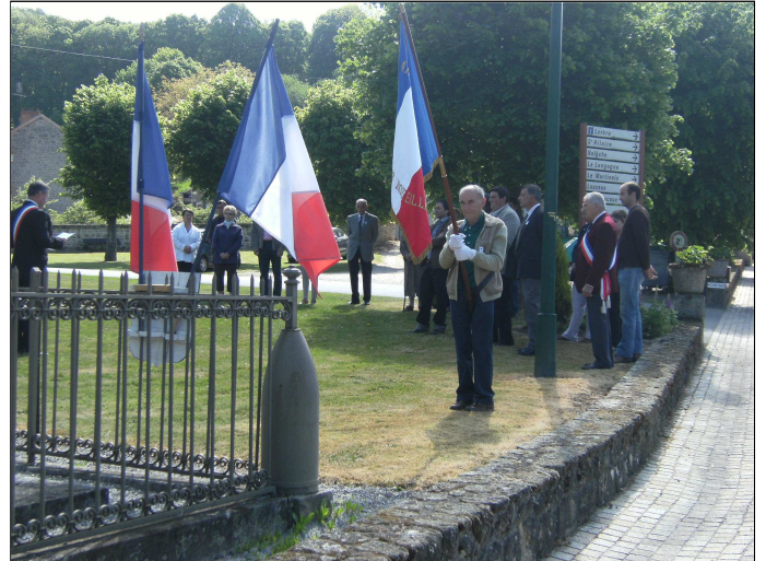
Cérémonie du 08 mai 2011