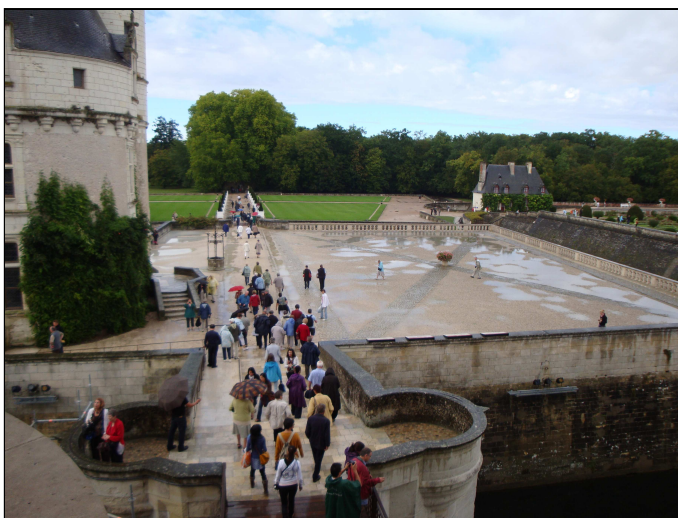
Les anciens élèves : Voyage en Touraine