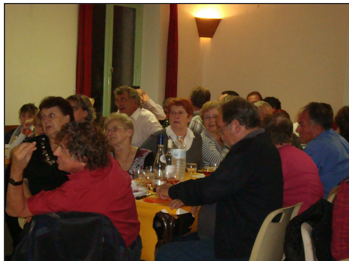
Top Gym : Soirée COUSCOUS

L'association est bien représentée au sein du comité départemental. En effet, deux licenciées de Moutier Rozeille sont pour l'une secrétaire générale, pour l'autre présidente.