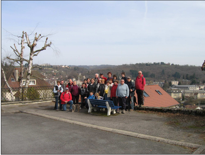
Rando nature : les randonneurs