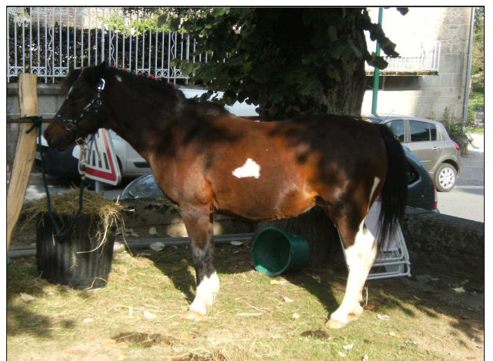
Trois représentants pour le monde équin