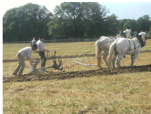
Le labour à l'ancienne