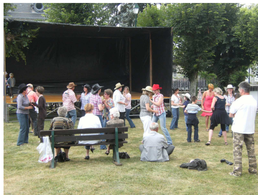
Démonstration de Country