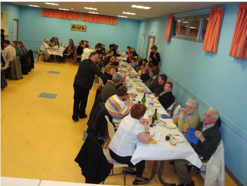
Soirée Top Gym à Saint Maixant (1)