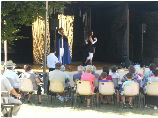
Ambiance cabaret sur la place