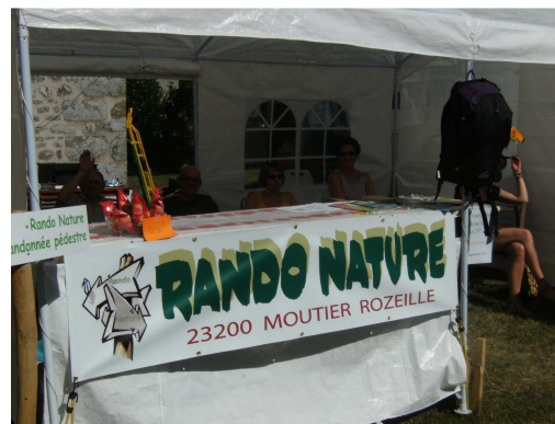
Le mythique stand de Rando Nature