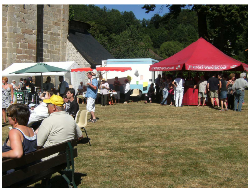
La place de Moutier Rozeille