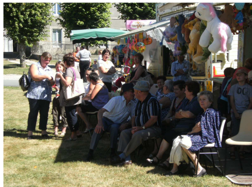
A la recherche de l'ombre