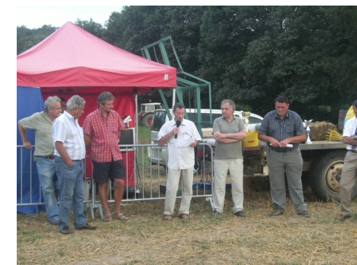
Discours avant la saucée