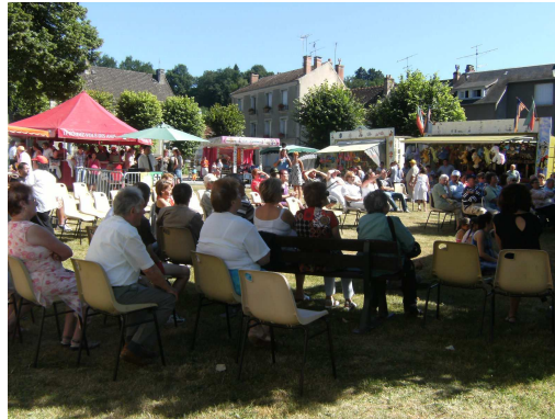
Un public nombreux