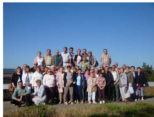
Les anciens élèves à Garabit