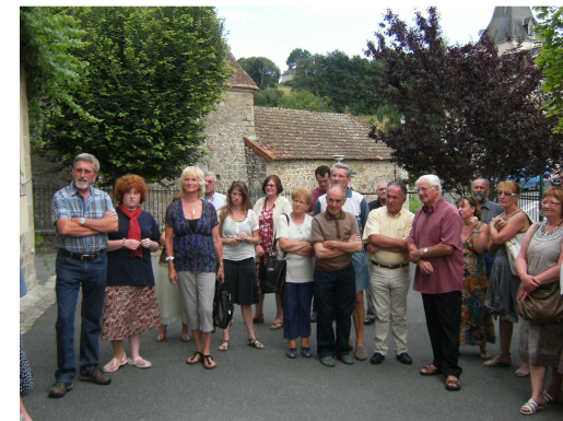
Une assistance nombreuse (1)