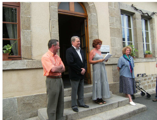
Artiste de La Rozeille

Un devis a été déposé en mairie pour la réfection des joints du mur du cimetière.