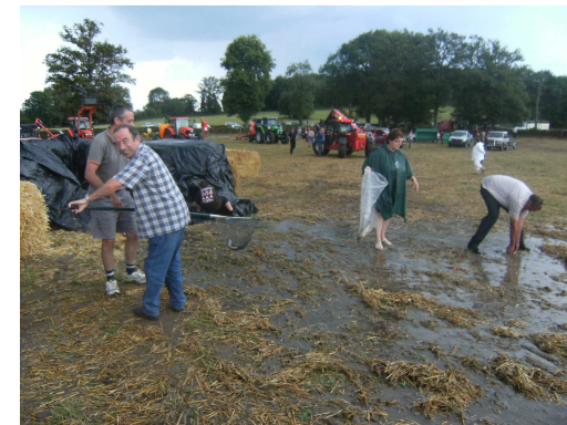
Pêche peu orthodoxe