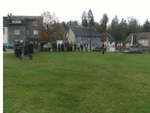
Cérémonie du 11 novembre 2010