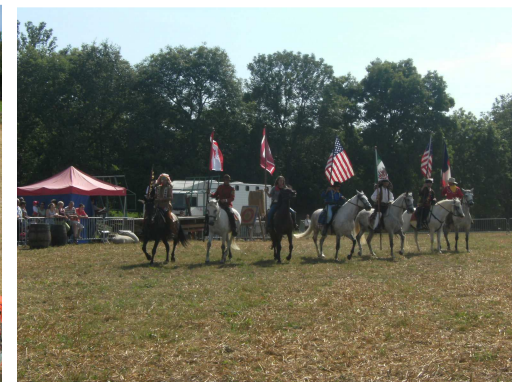
Spectacle du Far West