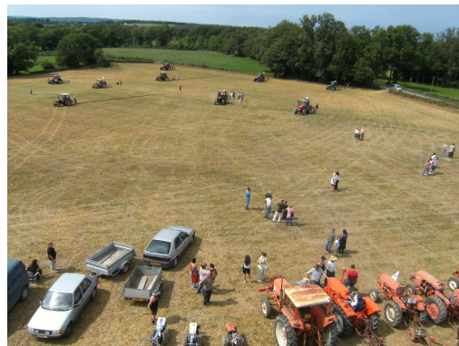
Concours de labour, vue d'ensemble