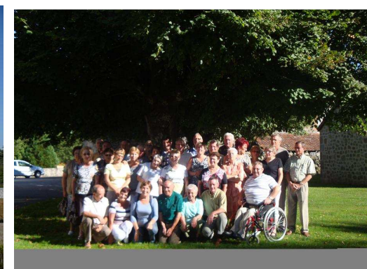
Banquet des anciens élèves à Néoux