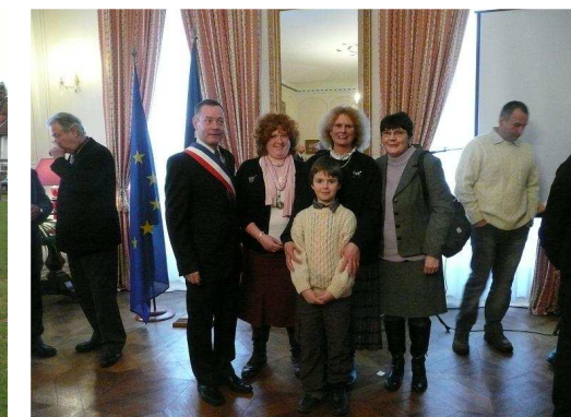
Remise de décret de naturalisation