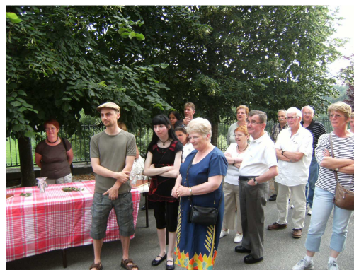
Une assistance nombreuse (2)