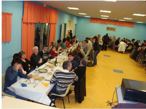
Soirée Top Gym à Saint Maixant (2)