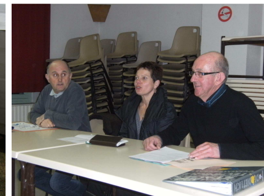
Bureau AG de Rando Nature