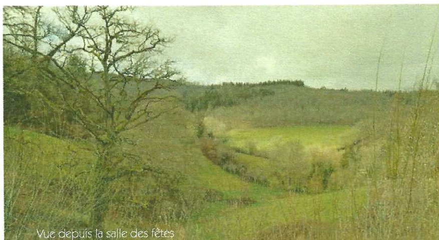
Vue depuis la salle des fêtes