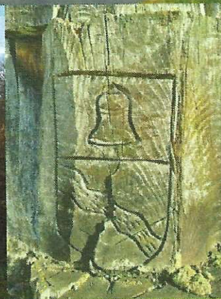
Blason gravé dans le séquoia