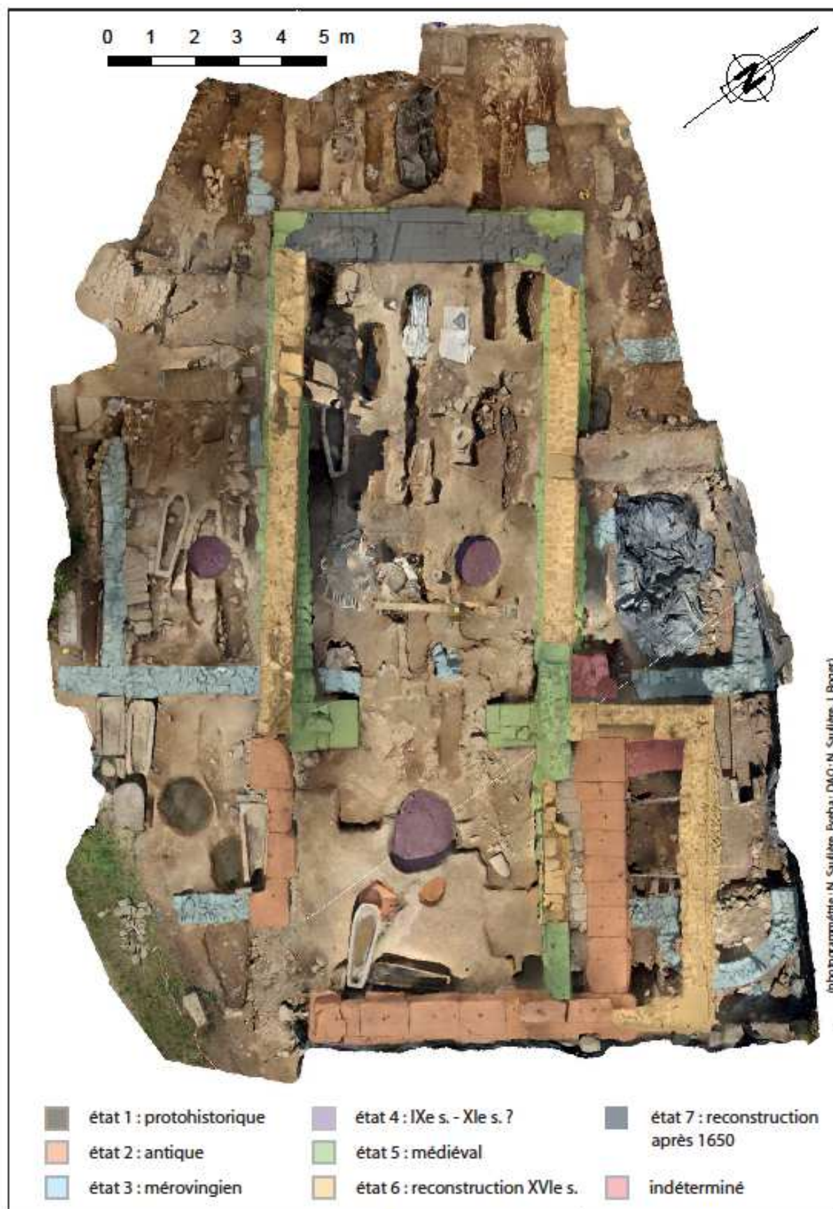
Fig. n° 1 : photogrammétrie du site de Saint-Hilaire : principales maçonneries encore visibles en 2016